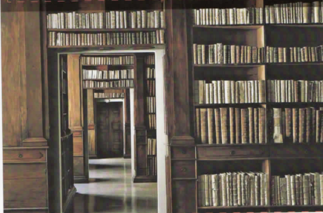
Imagen de la Biblioteca Nacional de Nápoles. / Massimo Listri