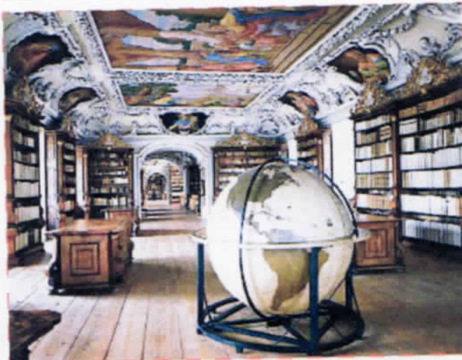
Biblioteca de la Abadía de Kremsmünster (Austria).

Las imágenes de Listri, claros ejemplos de perfección técnica y rigor formal,