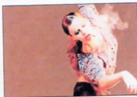
La artista, en una actuación de 2009.

"Me tiemblan aún las piernas. Estaba haciendo recados por Sevilla, bueno -se ríe- pagando deudas de Hacienda y me ha pillado totalmente desprevenida", aseguró Molina. "Siempre estoy pendiente para ver a quiénes se lo dan y felicitarlos, pero yo, con mis 26 años, no me lo esperaba para nada, aunque sí fuera un